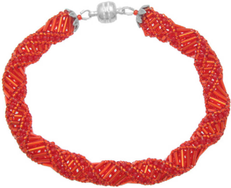
Bracciale "Calad Caran"